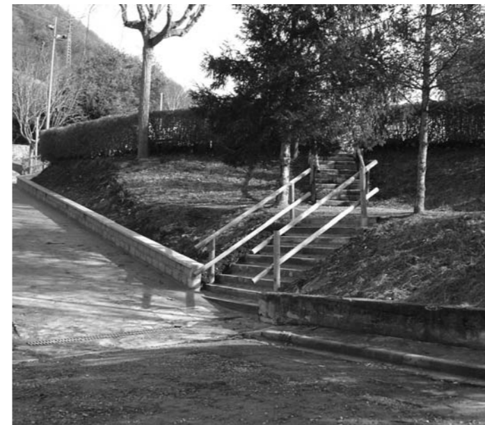
Vista Alegre: escala d'accés a la pista.