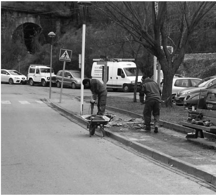
Obres al Grup Santa Maria

canals pluvials a la teulada de la pista coberta. Pavimentació de la pl. Catalunya, reparació embornal i pintar banes. Canvi de lluminàries a l'avinguda Comte Guifré entre la pista i carrer Sant Roc. Reparació vorera per treure humitats a les escales del carrer Comtat de Cerdanya. Col·locació de bandes rugoses per reduir la velocitat dels vehicles a la pujada de l'avinguda Comte Guifré. Col·locació tanca de fusta al voltant dels contenidors davant la pista.