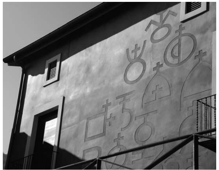
Museu de Ripoll