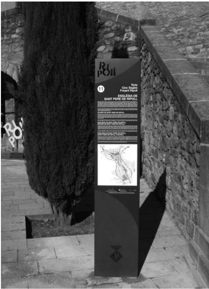
Nova senyalització "Cinc segles forjant Ripoll"

Cinc Segles Forjant Ripoll. La nostra vila ha ampliat la seva oferta turística amb una nova ruta anomenada "Cinc Segles Forjant Ripoll" on el fil conductor és la Farga Palau i el Ripoll del s. XVII. Aquesta ruta és el resultat d'un conjunt d'accions vinculades entre si i que dona com a resultat un recurs turístic complet. La primera acció que es va dur a terme va ser encarregar un estudi sobre l'entorn social i econòmic en què es trobaven els ripollesos al s. XVII aprofitant un dels testimonis més importants que ha sobreviscut al llarg dels segles, la Farga Palau.