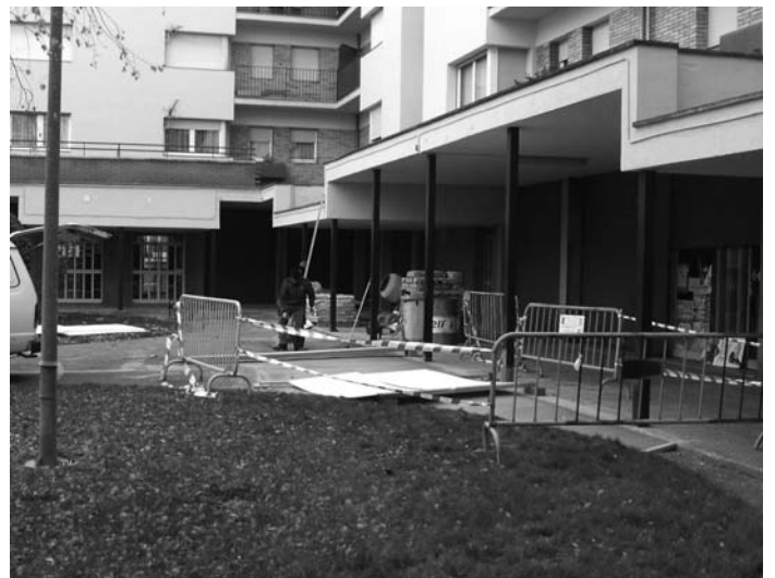
Reparacions al Barri de Sant Pere

Sant Pere. Reparació de paviment de les escales de la pl. Europa i pintar bancs. Completar la pavimentació i recollida d'aigües pluvials al carrer Comtat de Besalú. Connexió de