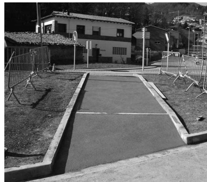
Supressió de barreres arquitectòniques a la rotonda del sud de Ripoll, entre Cal Déu i Agafallops

Engordans-Ciutat Jardí: repàs aglomerat asfàltic a tot el barri, reparació de voreres, obres d'ampliació enllumenat en el camí de baixada del carrer Ciutat Jardí i instal·lació d'un punt de llum; pintar pas inferior de la C-17; reparació baranes de ferro a la rotonda abans del carrer sant Amand; tancat de fusta als contenidors del carrer sant Amand; pintar aparcaments al carrer sant Amand i pas de vianants al carrer Ciutat Jardí; col·locació piona per impedir el pas de vehicles a la font.