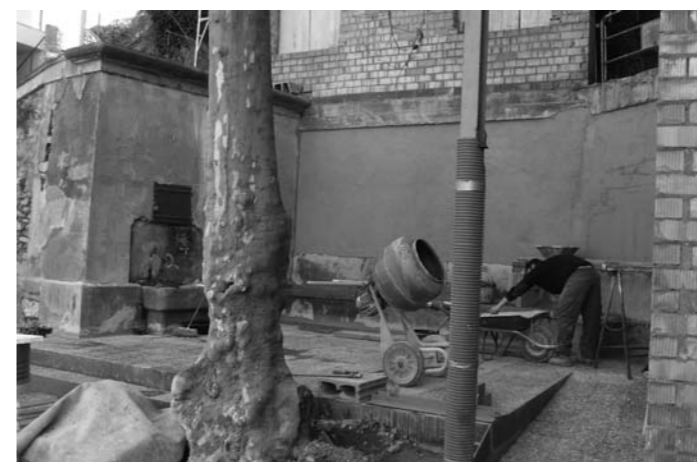
Font del Raval de Barcelona

Carretera de Barcelona. Instal·lació de pals de fusta amb plaqueta de ferro per identificar les espècies vegetals més representatives a la Devesa del Pla. Reparació joc infantil pg. Ragull. Font del Raval de Barcelona. Renovació a fons de l'entorn amb construcció d'escaleres i rampa, i nou paviment.