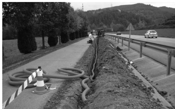
Il·luminació a la Ruta del Ferro

A la Ruta del Ferro, l'actuació ha consistit en col·locar lluminàries tipus led entre l'Escola del Treball, el pas soterrat sota la carretera i fins a l'encreuament amb el camí de les Carboneres (al polígon de Pintors). Al tram inicial -entre la rotonda d'Honorat Vilamanyà i l'Escola del Treball- s'han reparat els llums que no funcionaven i s'han canviat tots per leds de baix consum, contribuint així, a l'estalvi energètic.