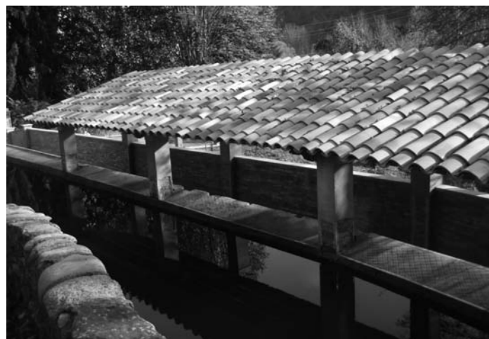
Rentadors de Can Pòlit

rehabilitació dels rentadors de Can Pòlit s'han mantingut els sistemes constructius i els materials que es van utilitzar antigament. A la vegada, s'ha previst una major durabilitat al canviar l'antiga coberta d'uralita i taulons, per una coberta de teules i bigues de fusta. També s'ha tingut en compte l'estètica dels rentadors amb l'entorn natural. Al mateix temps s'ha adequat un camí de connexió entre la font Viva i la passera de Can Guetes que passa pel costat d'aquests rentadors, on caminants i ciclistes poden gaudir d'aquest recorregut vora el Ter.