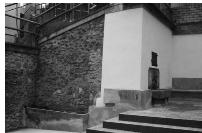
Remodelació de la font del Raval de Barcelona

Varis. Retirada de neu i repartiment de sal potassa durant una setmana. Muntatge de la Ripiganga. Instal·lació dels passos de Setmana Santa a la Sala Eudald Graells.