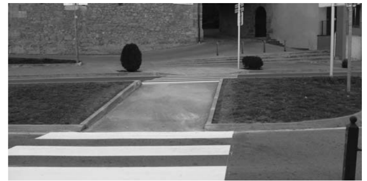
Nou pas de vianants entre el Raval de l'Hospital i el pont d'Olot.

Barri Estació i Fuensanta. Repassada general de panots i asfaltat al carrer Fuensanta i col·locació reixa darrera jocs infantils per evitar la sortida a les vies del tren. Col·locació barana de