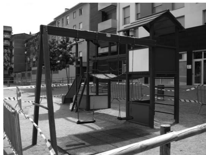
Jocs infantils a la plaça de la Sardana

Inauguració de l'exposició Experiències creatives a Ripoll. Parelles artístiques. Aquest és un projecte que s'emmarca en el programa d'activitats del Servei de Rehabilitació Comunitària del Centre Mèdic Psicopedagògic d'Osona. Es treballa amb l'objectiu de sensibilitzar la societat sobre la salut mental i evitar l'estigmatització de les malalties mentals. Consisteix en l'exposició d'un conjunt d'obres artístiques que han estat elaborades per una vintena de parelles formades per un artista professional i un artista amateur, usuari d'aquest Centre Mèdic. Al final del recorregut les obres es substaran i els beneficis recollits s'utilitzaran per donar continuïtat al projecte. Inauguració el divendres 12 de juny a les 19,30 hores a la sala Abat Senjust de l'Ajuntament i a les 20 hores al Cafè Canaules amb acompanyament musical.