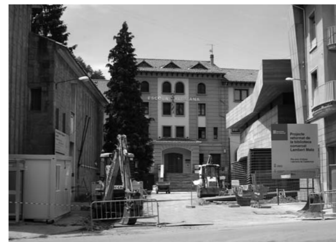
Carrer de les Vinyes, sector de l'escola salesiana i biblioteca

Noves subvencions de la Diputació i del PUOSC per a la Lira. En el darrer ple l'Ajuntament de Ripoll ha aprovat l'acceptació de la subvenció de 120.000 euros destinada a construir la passera que unirà l'espai públic Teatre La Lira amb el passeig del Mestre Guich. D'altra banda l'Ajuntament ha rebut també una subvenció de 240.000 euros de la Diputació de Girona per finançar part del cost de la passera i l'adequació de la sala polivalent que estarà ubicada sota la plaça coberta. Les subvencions rebudes fan que el cost de les obres per als ripollesos siguin considerablement baixes, en el cas de la passera l'ajuntament només ha de sufragar un 20% del cost de l'obra i en el cas de la sala polivalent un 28%.