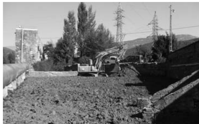
Millores a la Colònia Noguera

d'entrada a la vila. S'han realitzat uns treballs de fresat de 5 cm. en tot el traçat de la carretera i s'ha col·locat una capa d'asfalt a tot el tram, també s'ha pintat de nou la senyalització horitzontal de tot el tram i s'ha pintat un nou pas de vianants a l'alçada de la rotonda de Cal Déu, millorant així l'accessibilitat entre els barris situats a banda i banda de la carretera. En aquest punt, la brigada d'obres de l'ajuntament ha construït un gual per la banda de l'edifici de l'IES Abat Oliba per tal de suprimir barreres arquitectòniques a les persones que utilitzin aquest nou pas de vianants.