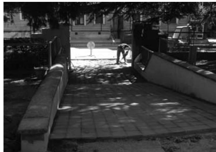
Millora de l'accés principal a l'escola Joan Maragall

Obres d'asfaltat a la carretera C-17. Durant el mes de setembre s'han dut a terme -per part de la Direcció General de Carreteres- les obres d'asfaltat de la C-17 a l'entrada de Ripoll, en el tram entre la carretera de les Lloses C-26 i la rotonda de Cal Déu. Aquesta obra s'ha efectuat després de reiterades peticions des de l'Ajuntament per tal de millorar aquesta via