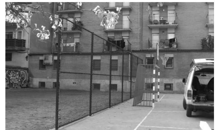
Plaça de la Sardana

Medi Ambient, ha impulsat una campanya de promoció de la tinença dels animals de companyia, centrada en tres eixos principals de treball: la inscripció al cens municipal d'animals de companyia; l'ús de la corretja; i les defecacions a la via pública. Aquesta campanya s'ha desenvolupat en dues fases: la primera ha estat de reforç informatiu, i ha tingut lloc del 19 al 25 d'octubre; la segona fase, de caràcter sancionador s'ha iniciat a partir del 26 d'octubre. Aquesta campanya pretén estimular el sentit de responsabilitat ciutadana que han de tenir els propietaris d'animals de companyia i que està regulada per una ordenança específica.