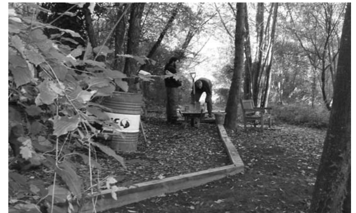
Passeig dels Aurons