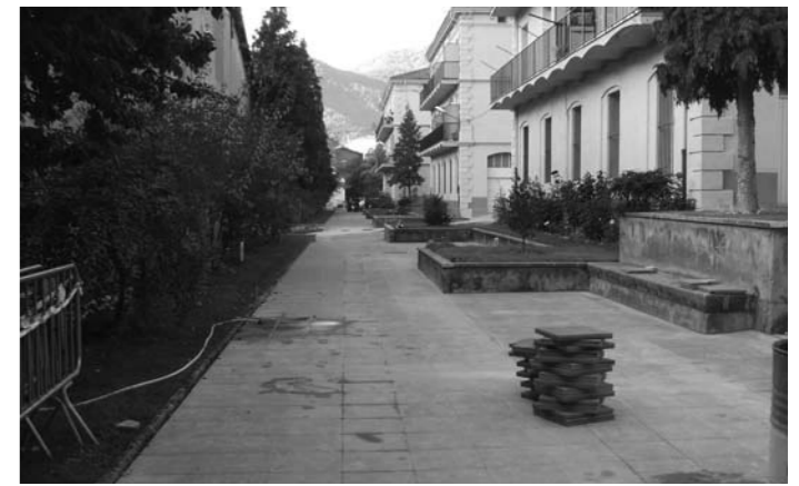
Passatge de les flors

Campanya de promoció de la tinença responsable d'animals de companyia. La Policia Local de Ripoll, en col·laboració amb la regidoria de